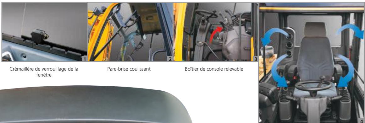
Crémaillère de verrouillage de la fenêtre