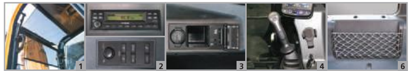
Pare-soleil enroulable Radio / MP3 avec télécommande Téléphone cellulaire mains libres Joysticks ergonomiques Compartiments de rangement